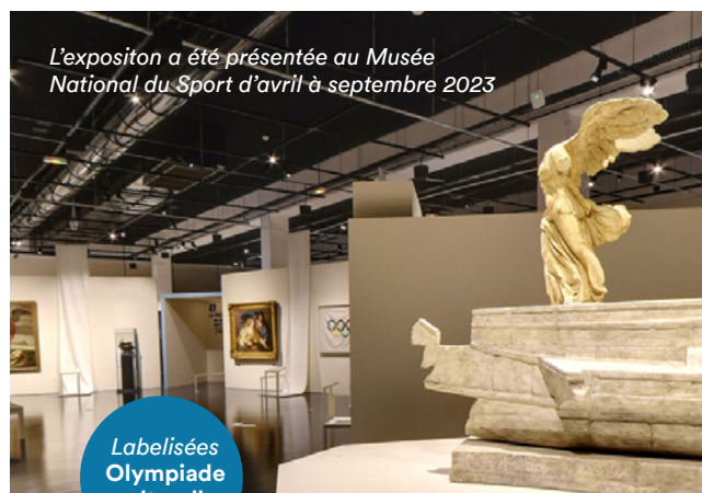
L'exposition a été présentée au Musée National du Sport d'avril à septembre 2023

Avec la collaboration exceptionnelle du musée du Louvre